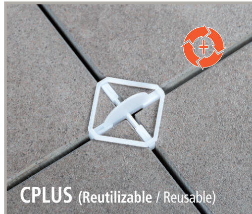
CPLUS (Reutilizable / Reusable)